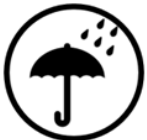
*9 Avoid humidity