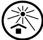
*10 Keep away from direct sunlight