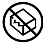
*9 Do not use if package is damaged