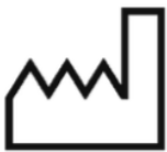
*5 Date of Manufacture