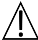
*10 Hazardous product, can cause certain irritations